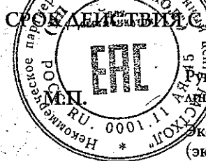
Схема сертификации 1с. Срок службы, условия безопасной эксплуатации, обслуживания, диагностирования, ремонта, хранения и утилизации оборудования установлены в эксплуатационной документации.